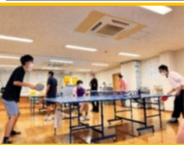
大会の様子。みんな真剣勝負

萌木の風卓球連盟主催の、第8回萌木の風杯卓球大会が開催された。皆が優勝者を予想する中、大方の予想を大きく裏切り、監督が2大会ぶり2度目の優勝を果たした。 総勢24名参加の今大会、予選は6名ひとグループ、全4グループでのリーグ戦。1セットマッチを戦い、各グループ上位3名が決勝トーナメントへ進む。決勝トーナメントでは勝ち上がった12名が萌木の風卓球の頂点をかけて戦う。 最近卓球部でもめまき腕を上げていっている部員たちをはじめ誰が優勝してもおかしくないともいえる大会史上屈指の戦いが繰り広げられた。予選が終了し、やはり前回大会優勝者や上位入賞者が順当に勝ち進んでいる中、スタツフ3名も