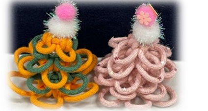
ミニツリーもかわいい