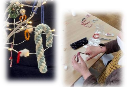
ひとつひとつ心を込めて