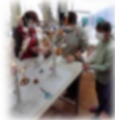
どこに飾るか作戦会議