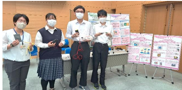
埼玉県立大宮工業高校の皆さん

毎年、講演会や交流会を通してALS患者さんの療養環境改善に少しでもお役に立てるように開催しております。今年は人口呼吸器メーカー等のブースの他に、埼玉県立大宮工業高校電子機械科の先生と生徒さんが、ALS患者さん向けのコールスイッチを披露してくださいました。これからの日本を担う若い力を感じました。