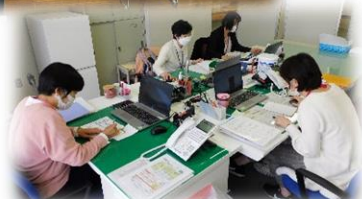
事務所は与野本町デイサービスセンターの1階です。