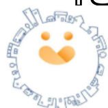
▲さいたま市チームオレンジ ロゴマーク

さいたま市より受託し、7月1日に開設されました。認知症と共生するまちづくりに取り組み、市民や企業、関係団体と協働しながら、認知症の人も自分らしく暮らせるよう、社会環境の創出や多様なまちづくりに参画することを目的とした機関です。ここでは4本柱であるセンター機能をご紹介します。