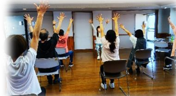
毎週火曜に 行われている 『カフェちいとも』