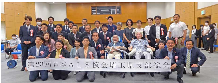
ご来賓として多数の国会議員、県会議員の方にもご参加いただきました