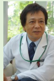
社会福祉法人 シナプス