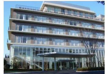
埼玉精神神経センター隣