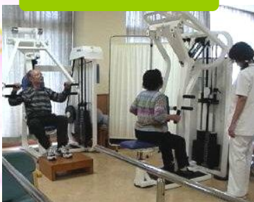
マシントレーニング